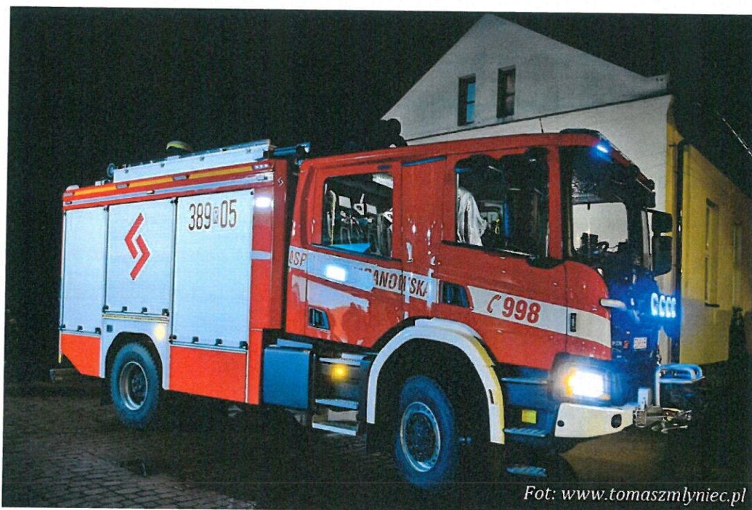
Nowy samochód otrzymany przez OSP Wola Baranowska