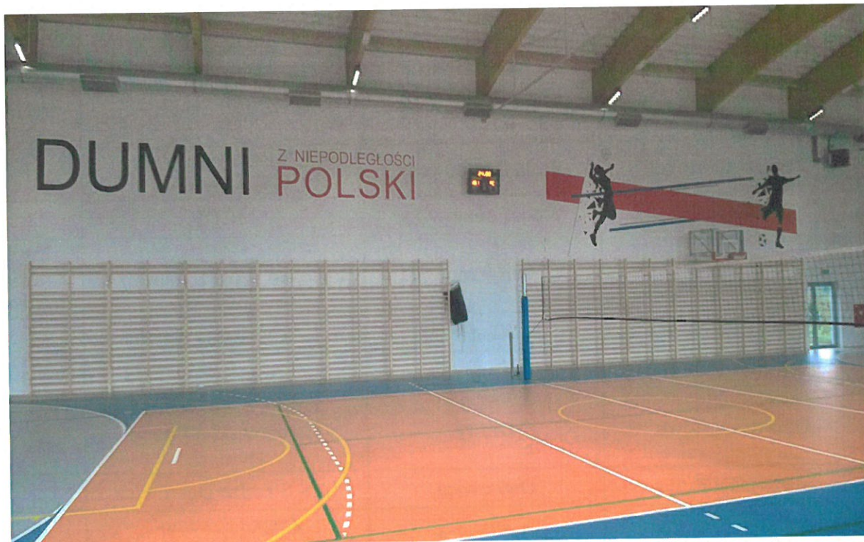
Hala Sportowa w Woli Baranowskiej