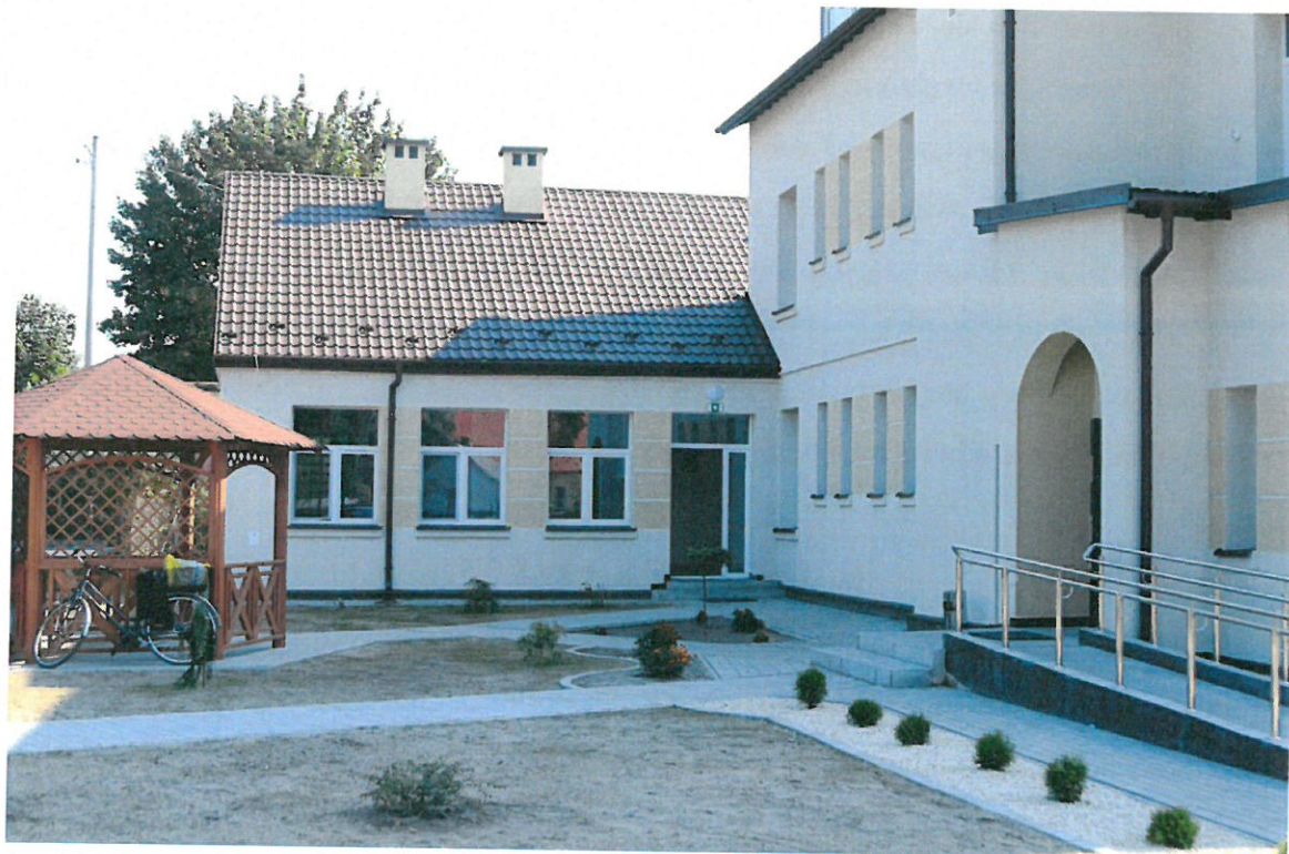
Nowa siedziba Środowiskowego Domu Samopomocy w Knapach

poprawiło jej warunki lokalowe – obecnie Dom spełnia wymagane prawem standardy. Ponadto dysponuje 3 pomieszczeniami dostosowanymi do pobytu całodobowego dla 6 uczestników.