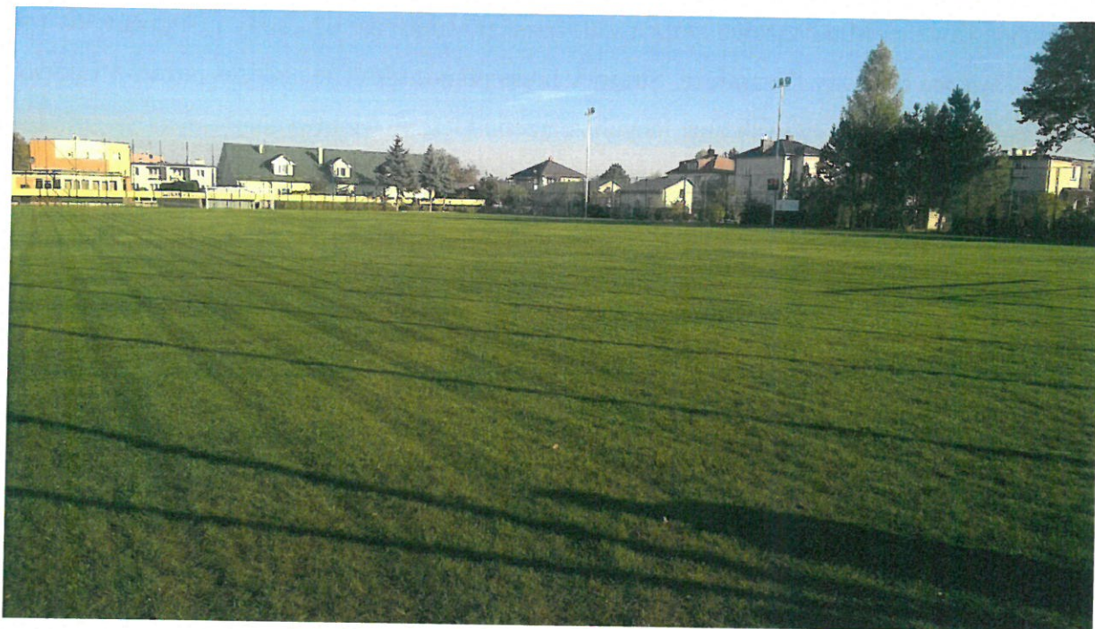
Zmodernizowana płyta stadionu w Skopaniu