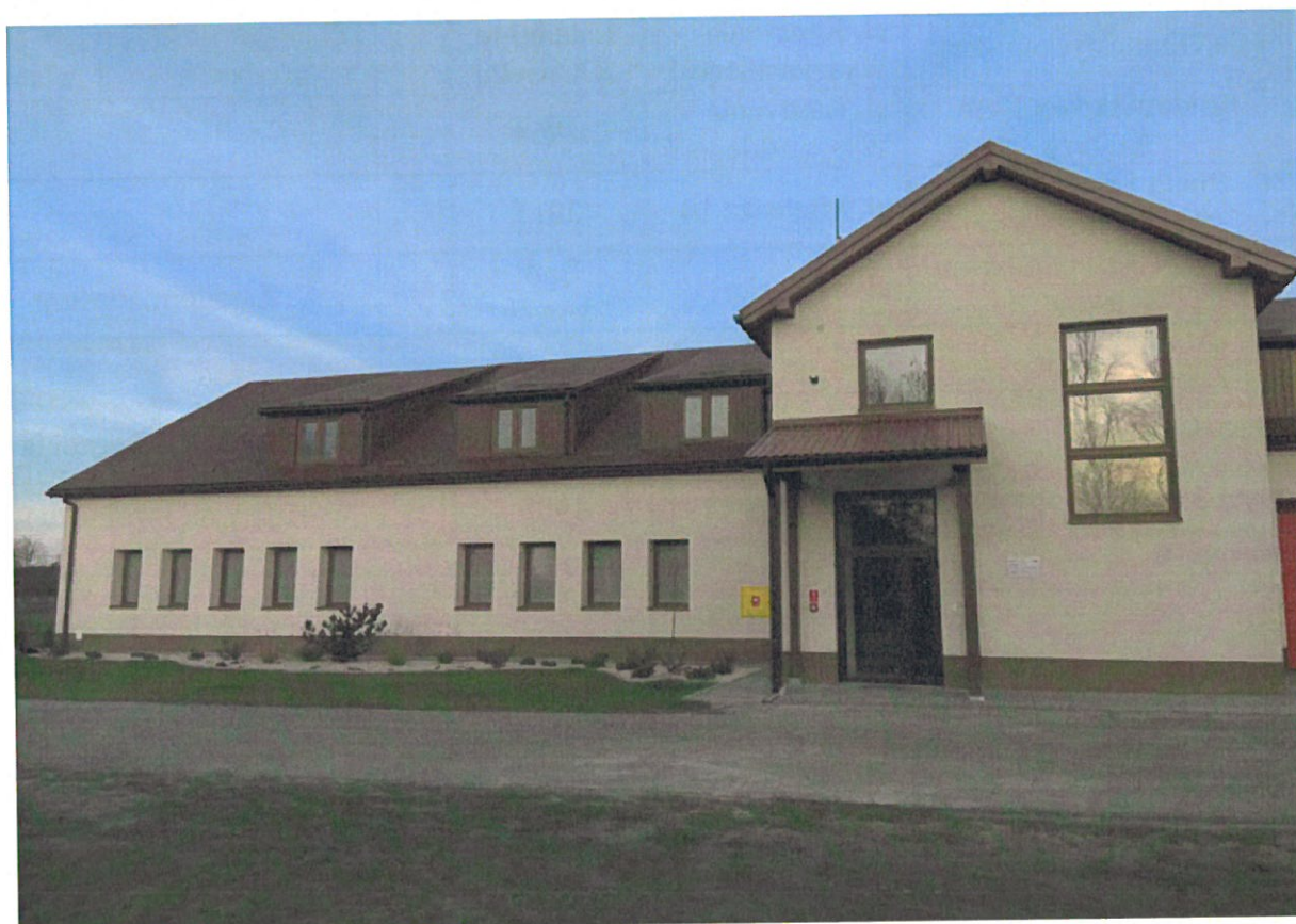
Centrum Rekreacji w Durdach