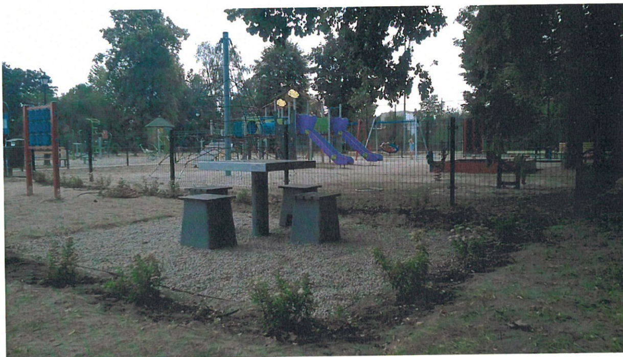
Otwarta Strefa Aktywności w Skopaniu