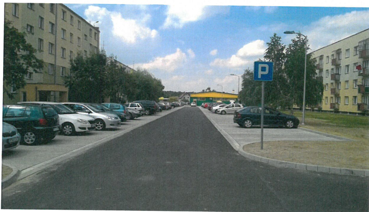
Droga w Skopaniu łącząca drogę wojewódzką nr 872 z drogą gminną nr 100023R