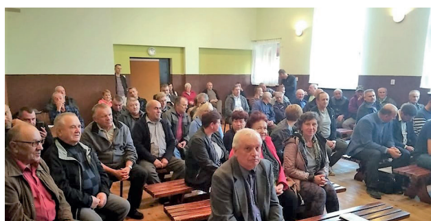
MIESZKAŃCY WOLI BARANWSKIEJ OD LAT CZEKALI NA TĘ INWESTYCJĘ