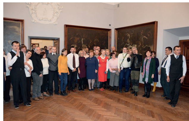
PAMIĄTKOWE ZDJĘCIE UCZESTNIKÓW