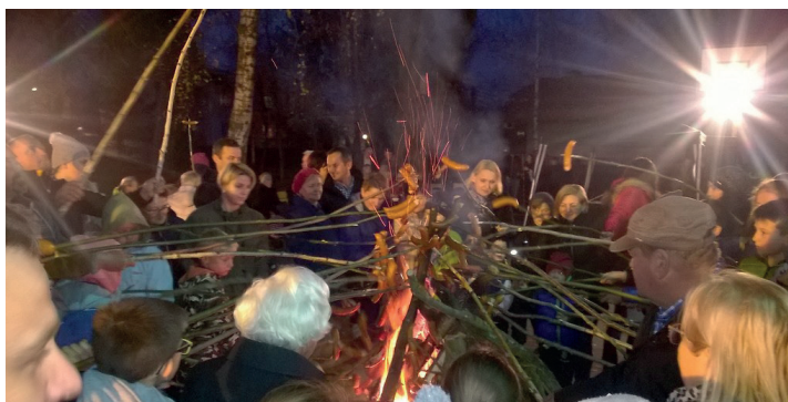
OGNISKO PATRIOTYCZNE W SKOPANIU

Główne uroczystości 100. Rocznicy Odzyskania Niepodległości przez Polskę odbyły się 11 listopada w Baranowie Sandomierskim. Obchody rozpoczęły się uroczystą Mszą Świętą w intencji Ojczyzny w kościele pw. Ścięcia Św. Jana Chrzciciela. Po zakończonej Mszy Świętej i przemarszu na baranowski rynek, wspólnie odśpiewano hymn, przy akompaniamencie gminnej orkiestry dętej.