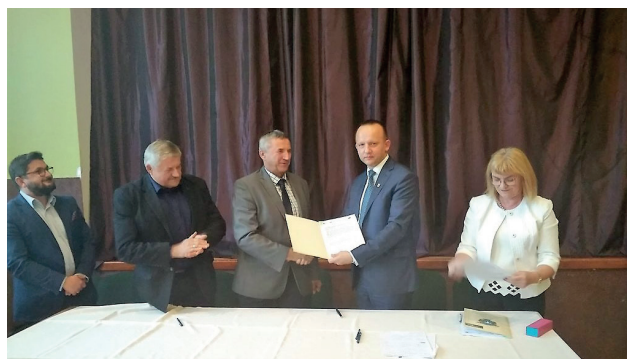
UMOWY JUŻ PODPISANE, WIĘC CZAS NA ICH REALIZACJĘ