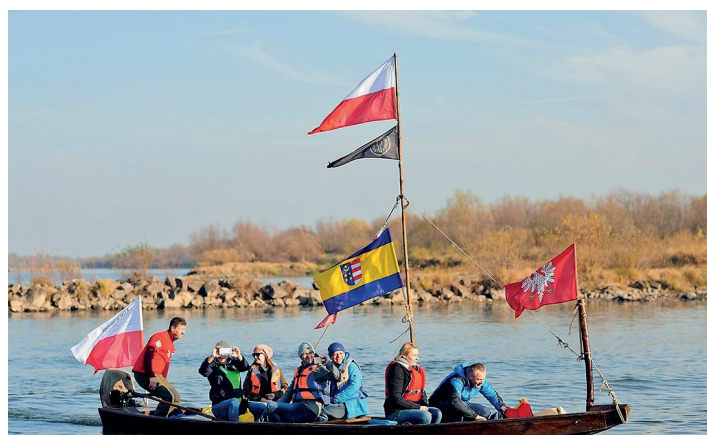
II WIŚLANY REJS NIEPODLEGŁOŚCI

Następnie odsłonięta została pamiątkowa tablica, którą wmurowano w ścianę Urzędu Miasta i Gminy Baranów Sandomierski. Tablicę poświęcono tym, którzy swoim życiem, walką i pracą zbudowali niepodległą Rzeczpospolitą. Kwiaty pod tablicą złożyli zaproszeni na tą wyjątkową uroczystość goście.