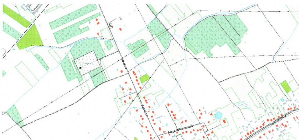
Mapa przedstawiająca lokalizację drogi gminnej (obok Pana Rzeszuta) działka nr ewid. 883 w Woli Baranowskiej