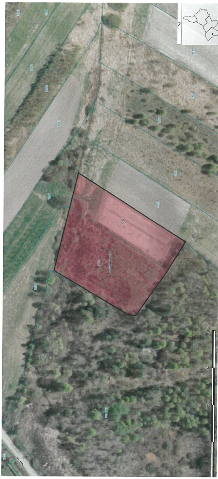
Wola Baranowska 3251; 3252

Załącznik nr 3 do uchwały Nr XX/152/16 Rady Miejskiej w Baranowie Sandomierskim z dnia 1 marca 2016 roku